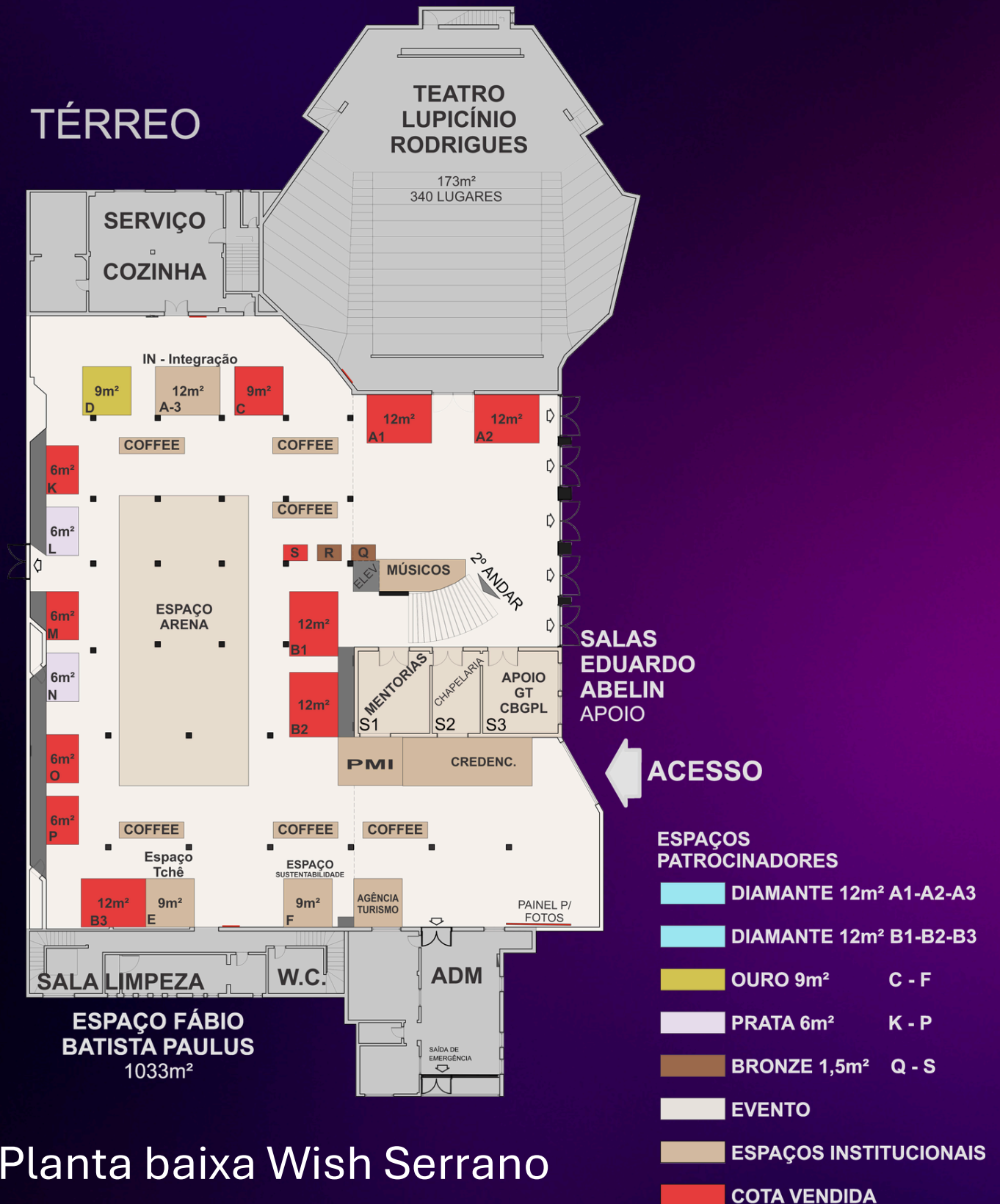
Planta baixa Wish Serrano