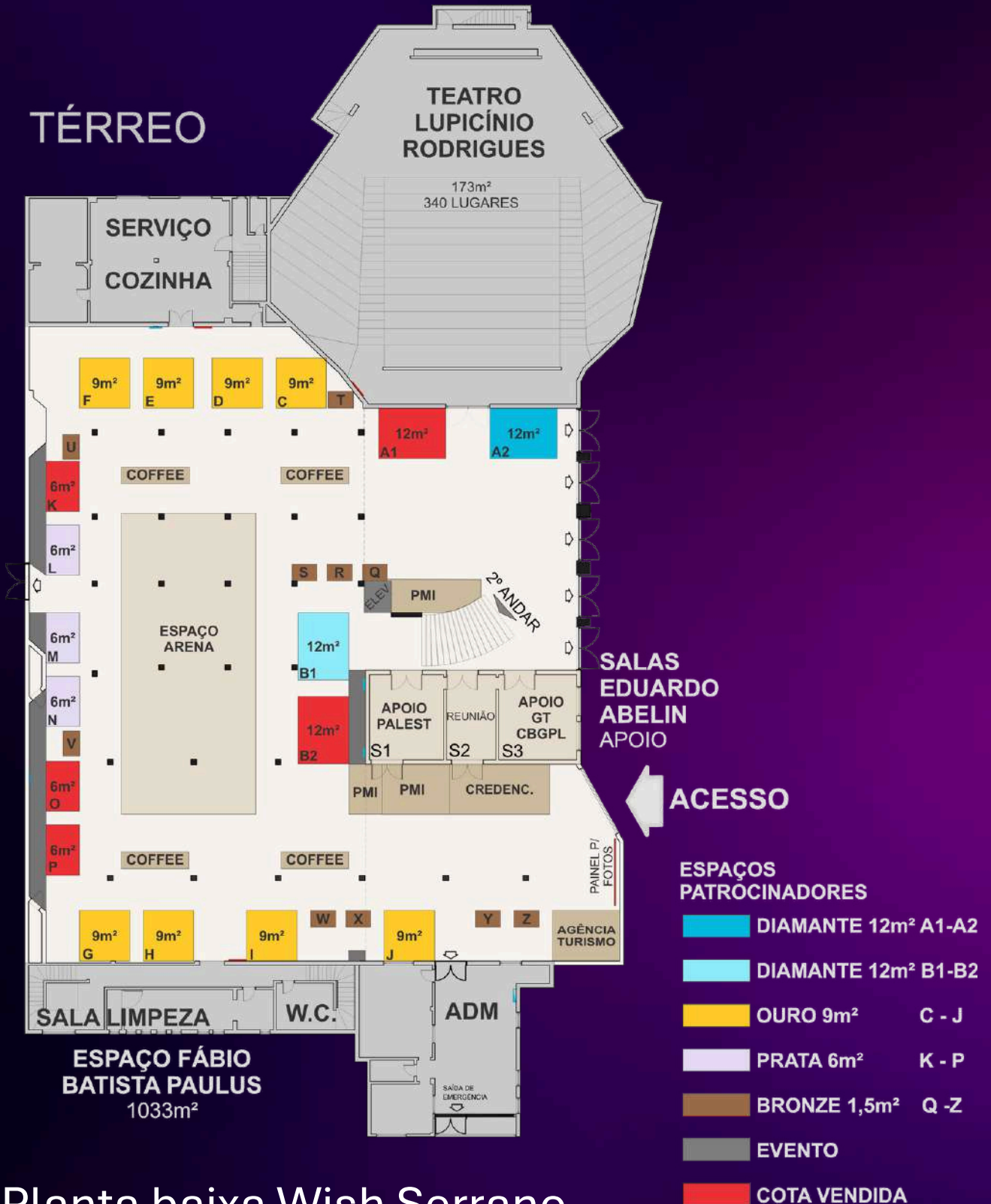
Planta baixa Wish Serrano